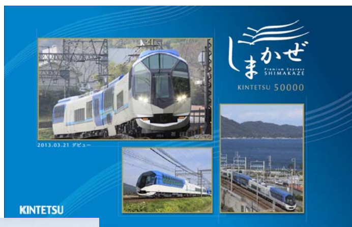
「しまかぜ運行記念 入場券セット」