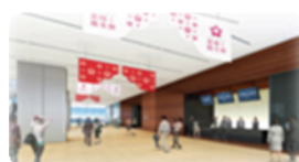
あべのハルカス美術館