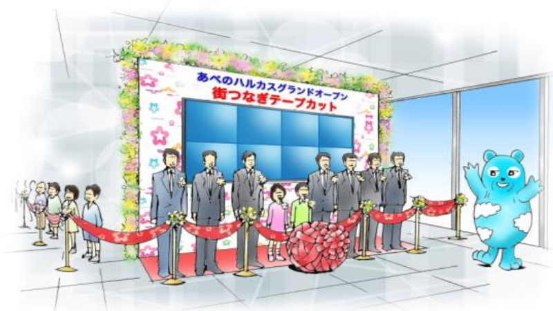
メイン会場：ハルカス300（展望台） でのテープカットのイメージ