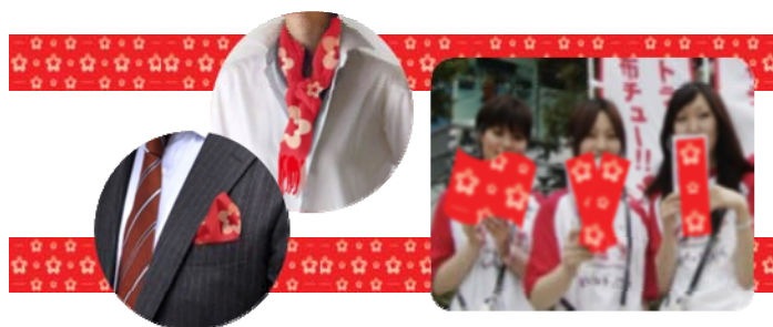
ハルカス花リボン（イメージ）