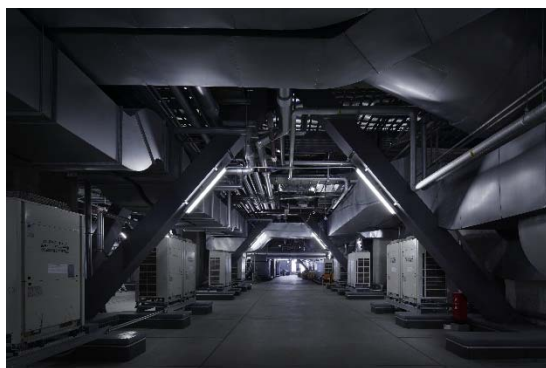
15階 機械室 (通路の様子)