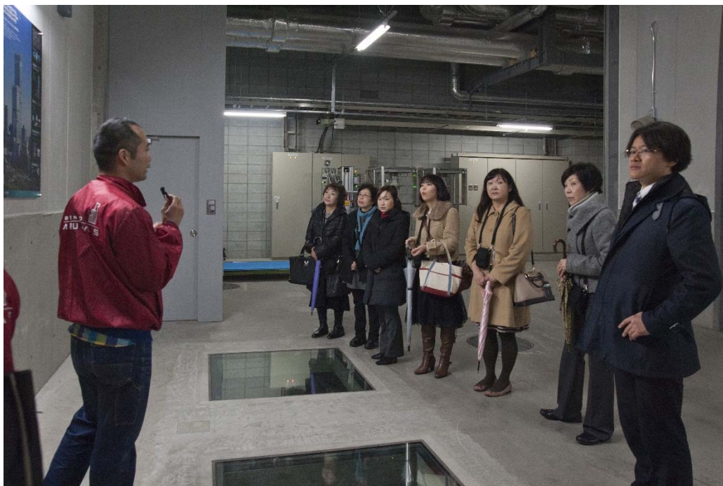
あべのハルカス探検ツアー イメージ