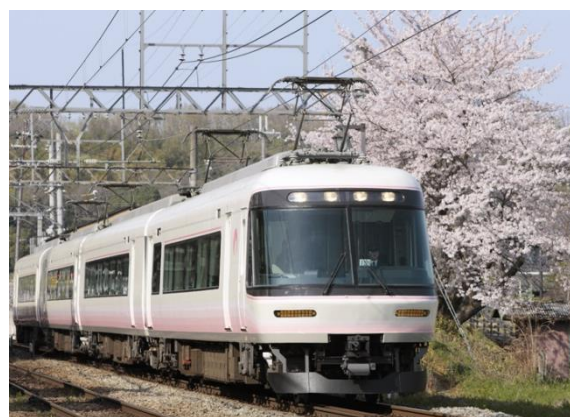
特急「さくらライナー」