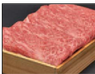
「伊勢神宮奉納 松阪牛」 50名様