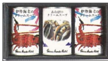
「あわびクリームスープセット」 70名様