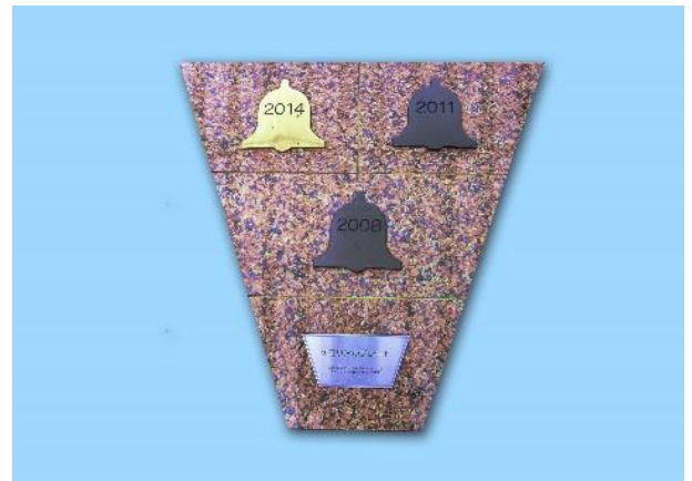
メモリアルプレート