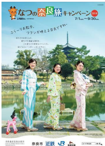
(パンフレット表紙)