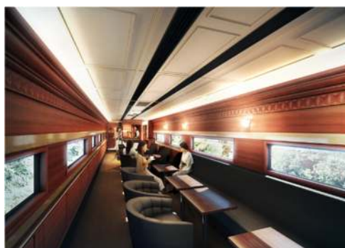
ラウンジスペース（イメージ）