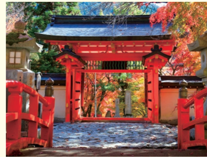
大峯山龍泉寺 大峯山の開祖、役行者ゆかりの名刹。修験道の根本道場として信者、登山者が必ず訪れる霊場です。