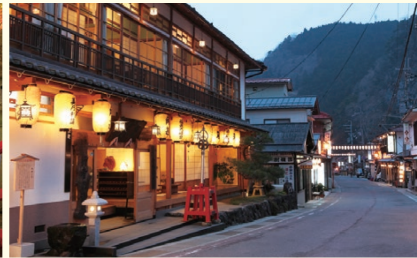
洞川温泉街 昭和レトロな雰囲気や懐かしさを感じさせる街並みには旅館や民宿、土産物屋が軒を連ねます。宿の縁側を利用したカフェなど、温泉街の散策も旅の楽しみの一つです。