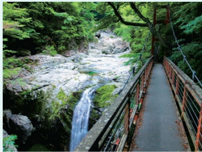
みたらい遊歩道 洞川温泉まで続く約7kmの遊歩道。雄大な滝や新緑、紅葉など四季折々の渓谷美が堪能できます。