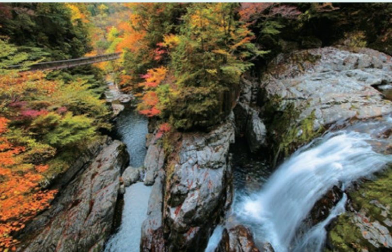
みたらいの滝 総落差約25m、幅広で水量が多く迫力満点。つり橋からは大自然が作り出す絶景が楽しめます。紅葉の見頃を迎える11月4日・5日(予定)に「天の川もみじまつり」開催。