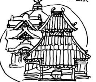
宝山寺の境内は本堂、聖天堂、多宝塔、経馬堂に洋風の獅子閣などがひしめきあっています。

暗峠 大坂の中心部と南都・奈良を結ぶ最短路として古くから発達し、初瀬や伊勢へ参る人もここを通った。当時の面影をしのぶものとしては、石畳や道標・石仏などが残る。信貴生駒スカイラインとは立体交差している。