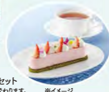
季節のオリジナルケーキセット ※オリジナルケーキは季節により変わります。 ※イメージ