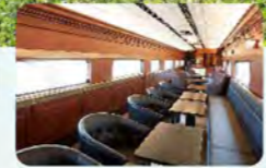
優雅に飲食を楽しめるラウンジ車両