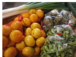
明日香村 飛鳥のうまいもん