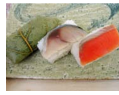
文久元年創業 平宗の柿の葉ずし (12月8日のみ)