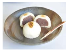
橿原市 酒まんじゅう出世男