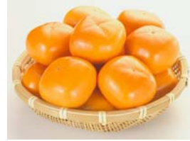
王隠堂農園 たねなし柿