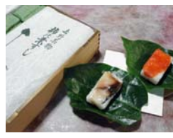
やっこ 吉野名物 柿の葉寿司 (12月8日のみ)