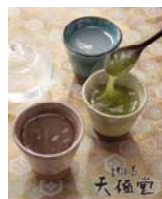
吉野本葛天極堂 葛湯