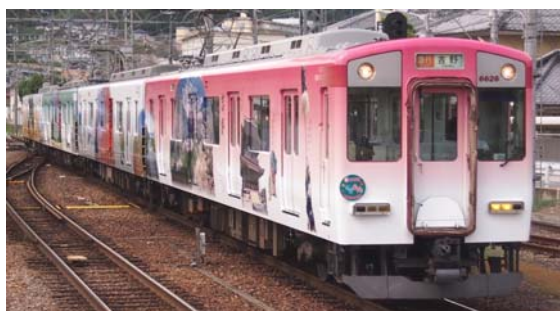
「吉野線ラッピング列車」