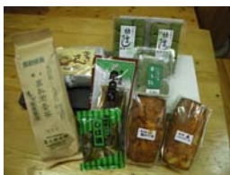
大淀町 道の駅売れ筋商品