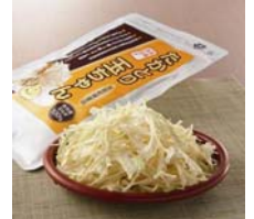
高取町 高取玉ちゃん