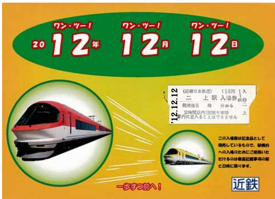
「12・12・12」記念台紙付入場券（イメージ）