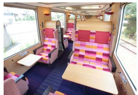
（サロンシート・ツインシート）