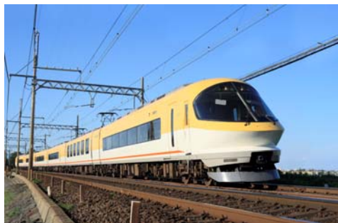
（伊勢志摩ライナー）