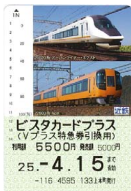
(ビスタカードプラス)