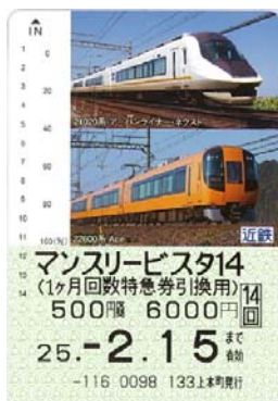
(マンスリービスタ14)