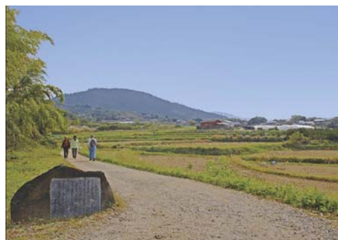
三輪山と額田王歌碑（山の辺の道）