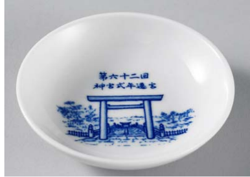
「盃（伊勢神宮 宇治橋のデザイン）」