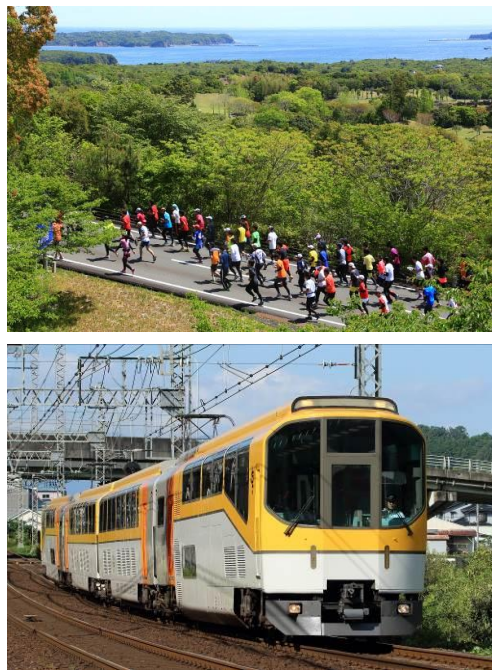
専用臨時列車「走りゃんせ号」(イメージ)