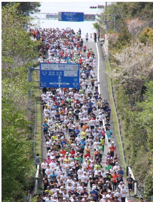
「志摩ロードパーティ」走行コースの一部

また、本大会のご参加に便利なツアーを実施します。ツアーでは、全席指定の専用臨時列車「走りゃんせ号」を大阪および名古屋方面から運転します。近鉄では、さらに多くの皆様に、大会参加を通じて志摩の景観や美食に触れていただき、再度訪れたい観光地として、伊勢志摩の魅力を再認識していただければと考えています。