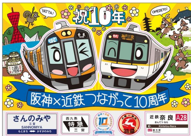
<オリジナルマグネットシート>