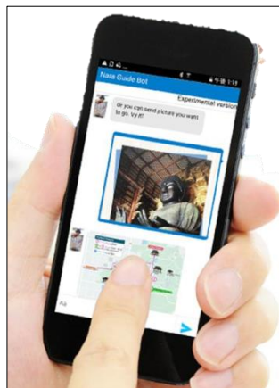
「奈良ガイドボット」の利用イメージ図

本実証実験では、多くの外国人観光客が訪れる近鉄奈良駅にNTT西日本がWi-Fi環境を構築、NTTが画像認識AI機能「かざして案内 ®*2 」と対話AI機能「チャットボット *3 」を組み合わせた「マルチモーダル・エージェントAI *4 」を提供し、利用頻度、コンテンツ満足度、ネットワークを含むICT環境の快適度等を分析し、商用化に向けて検討を行います。なお、本実証実験においては、英語・中国語(繁体・簡体)に対応します(別紙2参照)。