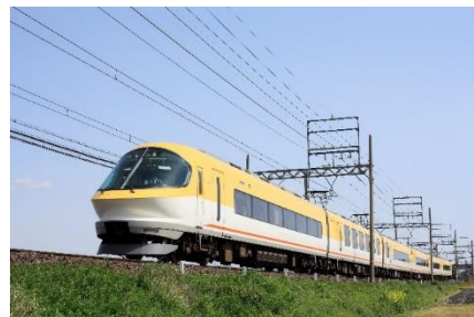
「伊勢志摩ライナー」