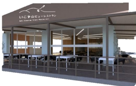
ビューレストランの全景(イメージ)