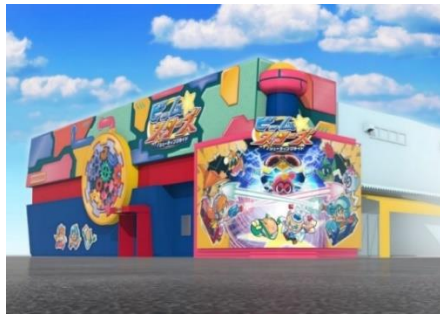
新アトラクションの外観(イメージ)