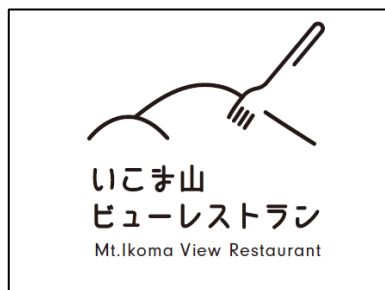
ビューレストランロゴ