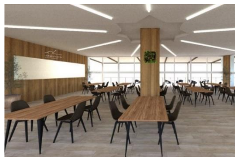
ビューレストランの内装(イメージ)