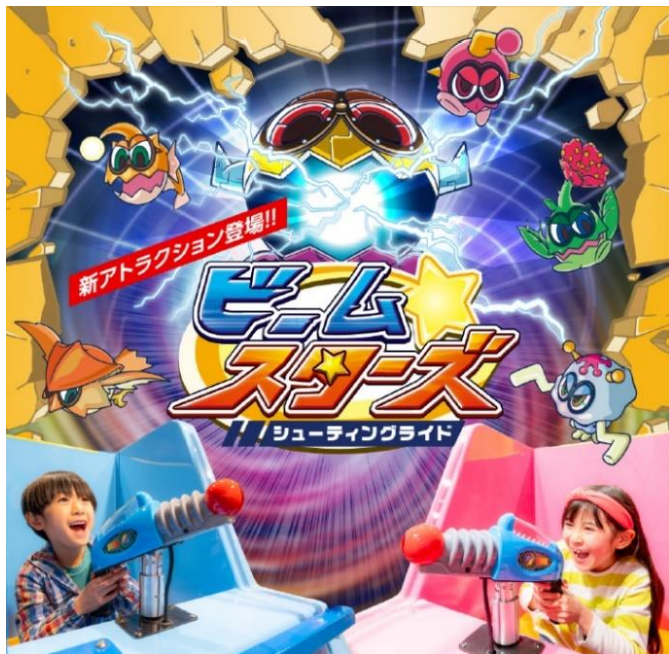
新アトラクションのイメージ