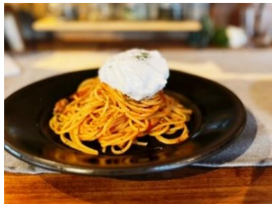
ふわふわソースのボロネーゼ