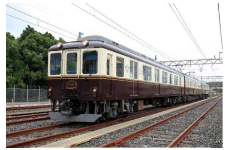
観光列車「つどい」外観

リニューアルした観光列車「つどい」の車内に足湯キットを設置し、湯の山線沿線にある菟野温泉の源泉からくんできた温泉で足湯が体験できる「足湯列車」を運行します。