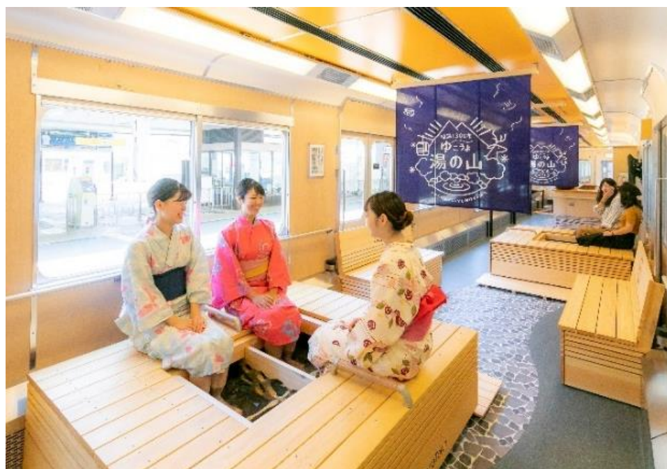
「足湯列車」車内（イメージ）