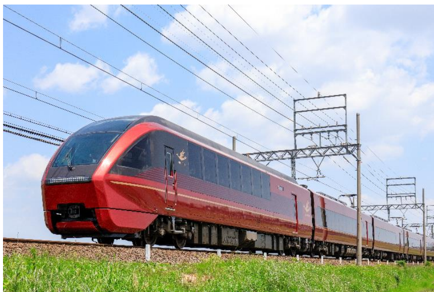
名阪特急「ひのとり」

なお、当社車両のブルーリボン賞の受賞は、2014年の観光特急「しまかぜ」以来、7年ぶり9回目となります。