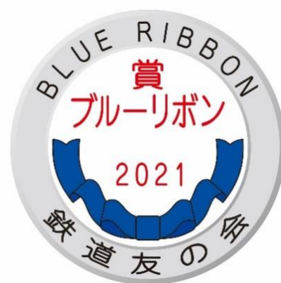
受賞記念プレート