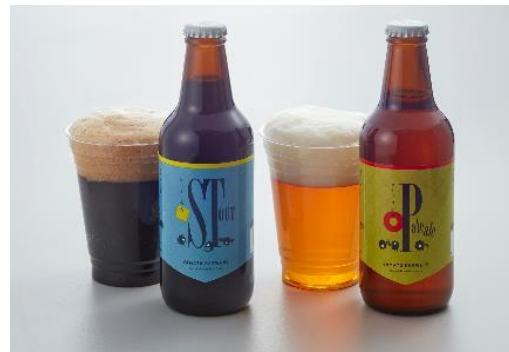
大和醸造クラフトビール