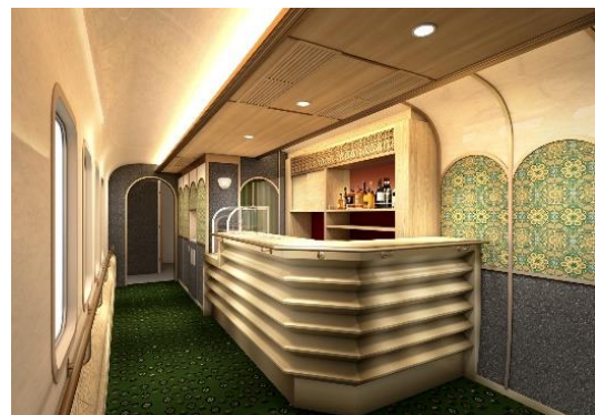
販売カウンター（イメージ）