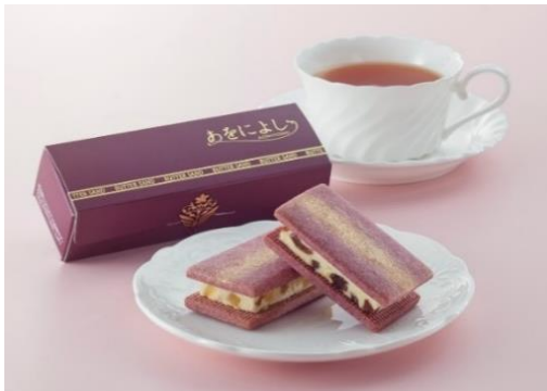
あをによしバターサンド