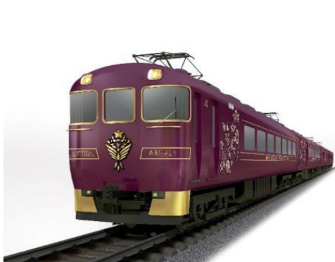
観光特急「あをによし」外観（イメージ）