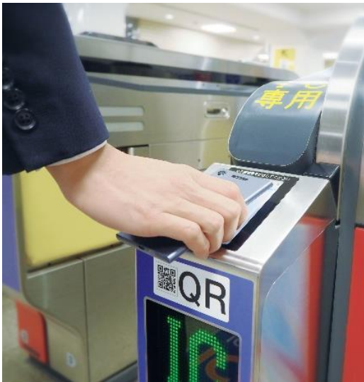
【 デジタルきっぷ利用イメージ（自動改札機）】