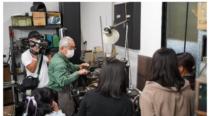
(FactorISM-アトツギたちの文化祭 開催時の画像)