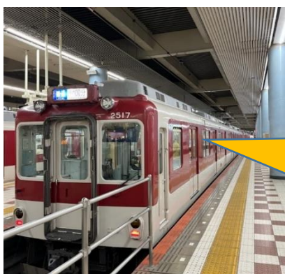
電車内でワークショップを実施（イメージ）