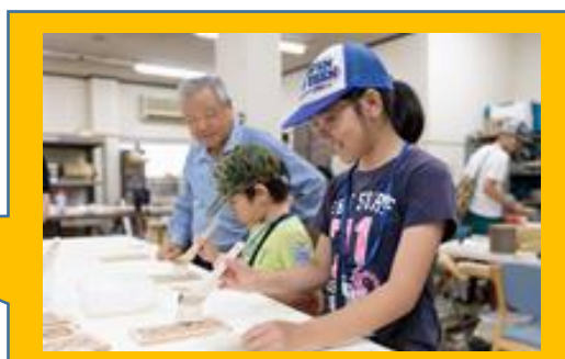
過去の和紙貼り体験の様子

◎FactorISM とは・・・ものづくりの現場を一般公開し、世界に誇る日本のものづくりの現場を体験、体感してもらおう文化祭のようなオープンファクトリーイベントです。