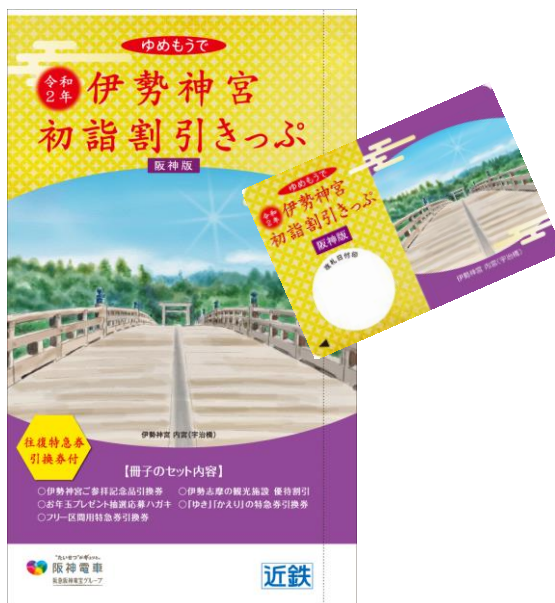
阪神版「伊勢神宮初詣割引きっぷ」

これらの便利でお得な初詣きっぷで、伊勢神宮をはじめ阪神・近鉄沿線の初詣・初旅にぜひお出掛け下さい。