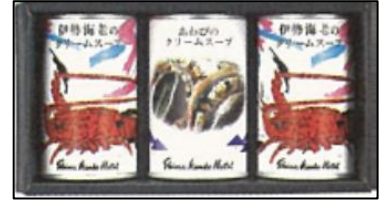
「志摩観光ホテル伊勢海老の クリームスープ&あわびク リームスープセット」 70名さま