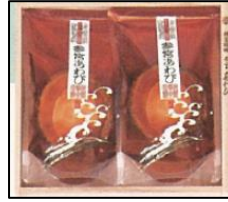
「参宮あわび」 50名さま