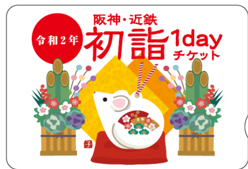
「阪神・近鉄 初詣 1day チケット」