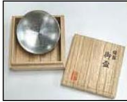
令和賞 「錫製平盃」 (宇治橋イラスト入り) 30名さま