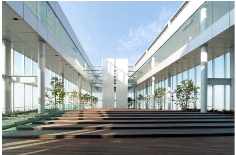
上：展望台「ハルカス300」 左：「あべのハルカス」全景