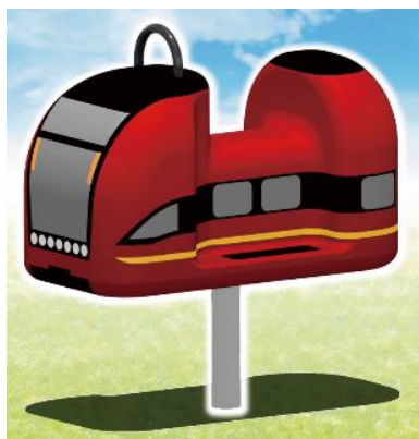
（ミニひのとり イメージ）