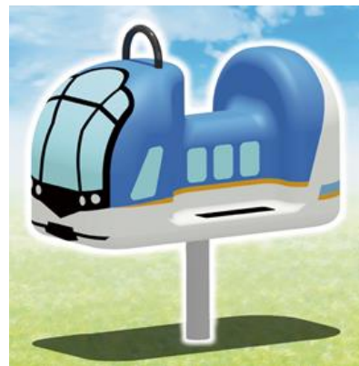
（ミニしまかぜ イメージ）