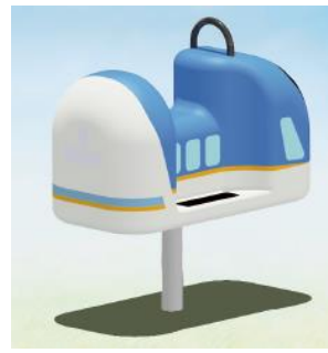
<ミニしまかぜ 外観イメージ>