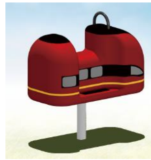
<ミニひのとり 外観イメージ>