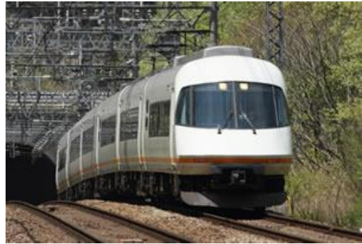
「アーバンライナー・プラス」