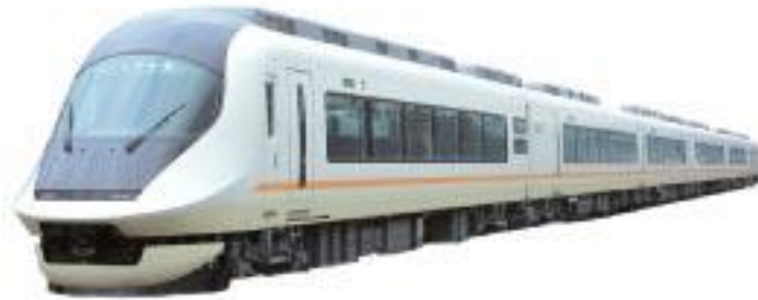
「アーバンライナー・ネクスト」