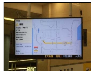
「情報配信ディスプレイ」