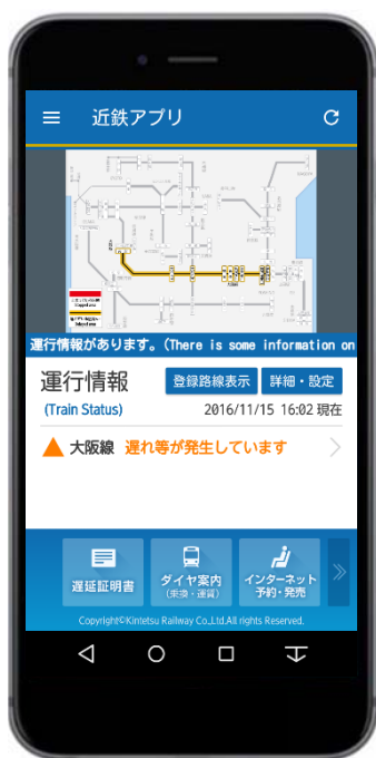
「近鉄アプリ」Top画面 (イメージ)