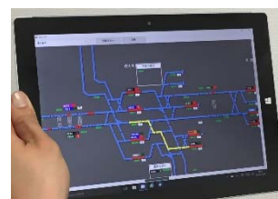
駅係員が携行する タブレット端末