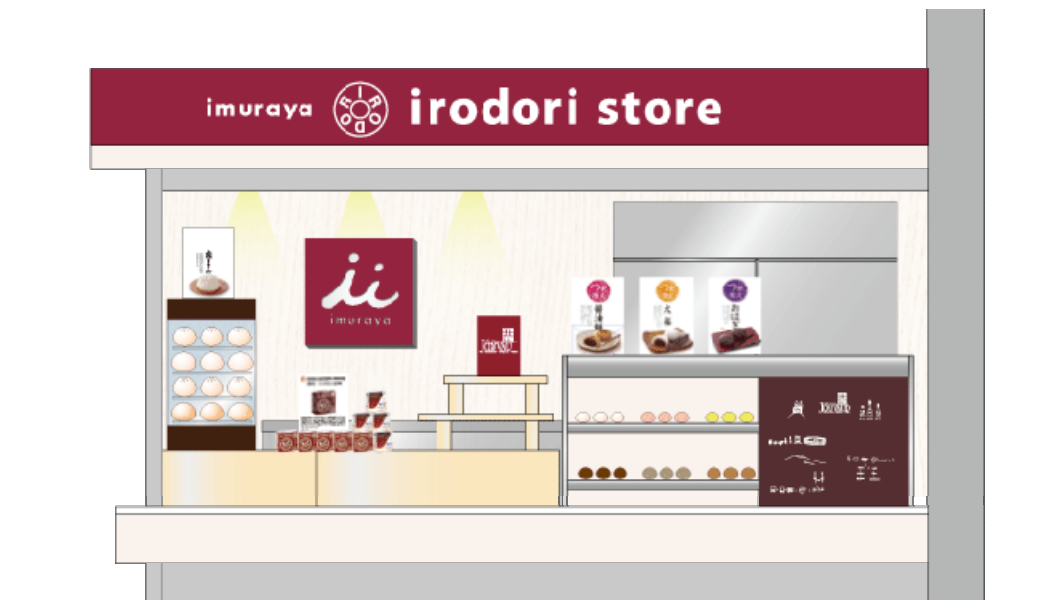
「imuraya 彩ストアー」イメージ図