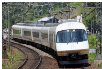
「アーバンライナーplus」