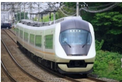
「アーバンライナーnext」