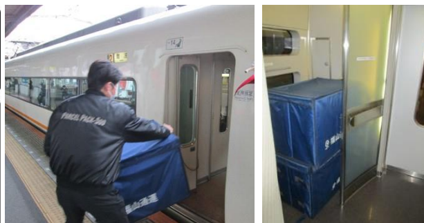
アーバンライナーへの積載（イメージ）