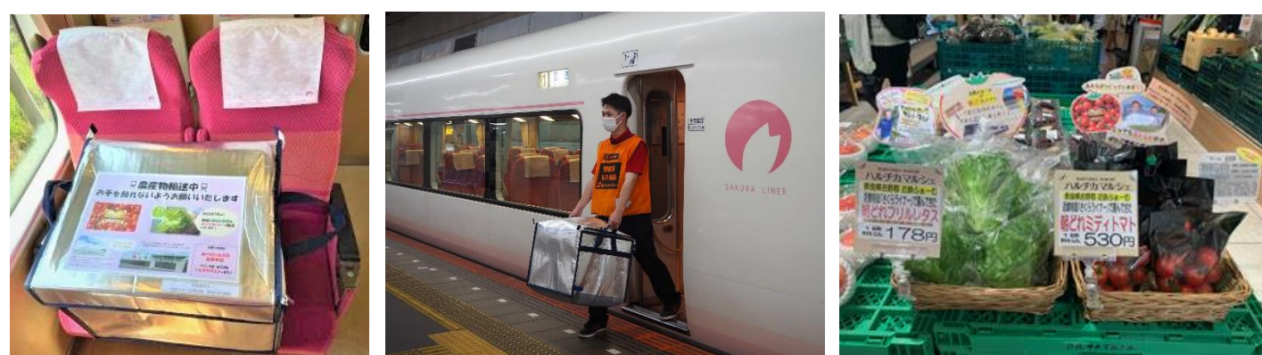
「さくらライナー」での貨客混載輸送と「ハルチカマルシェ」での販売の様子（イメージ）