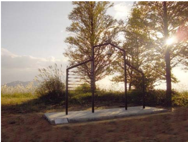
葛城高原（天空のハッピーベル）