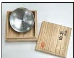
令和賞 「錫製平盃」 (宇治橋イラスト入り)