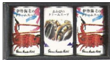
「志摩観光ホテル伊勢海老の クリームスープ&あわびク リームスープセット」