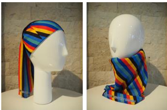
I. 近鉄×名鉄 コラボターバンだな