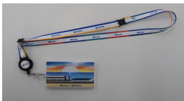
近鉄×名鉄 コラボネックストラップ・コラボパスケース

コラボパスケースには、両社を代表する特急「しまかぜ」・「ミュースカイ」のデザインが採用されています。近鉄「しまかぜ」は「上質のくつろぎとともに伊勢志摩へ。」をコンセプトに大阪難波、京都および近鉄名古屋～賢島間で運行している観光特急です。