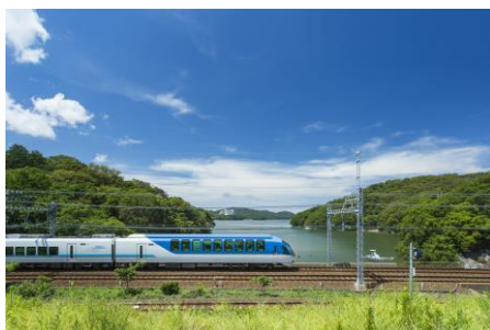
近鉄 観光特急「しまかぜ」

この機会に、グッズを通じて両社の魅力を改めて感じていただければと考えております。