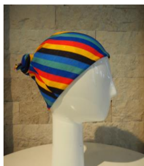
近鉄×名鉄 コラボターバンだな