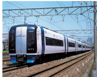
名鉄「ミュースカイ」