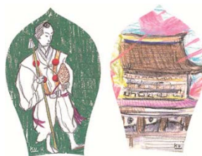
金峯山寺記念散華