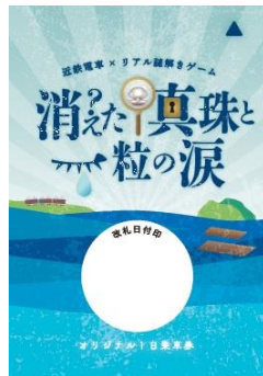
オリジナルデザイン1日乗車券