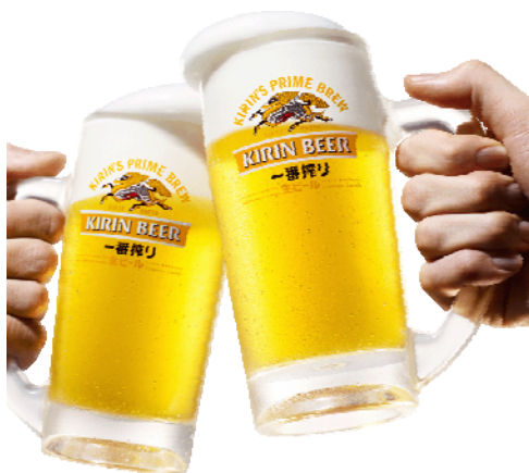
麒麟ビール 一番搾り（イメージ）