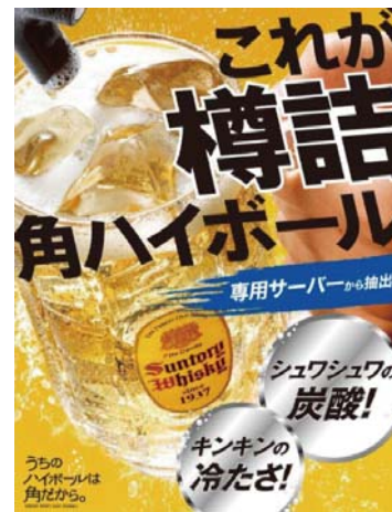
サントリー 角ハイボール（イメージ）