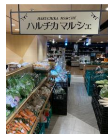
「ハルチカマルシェ」