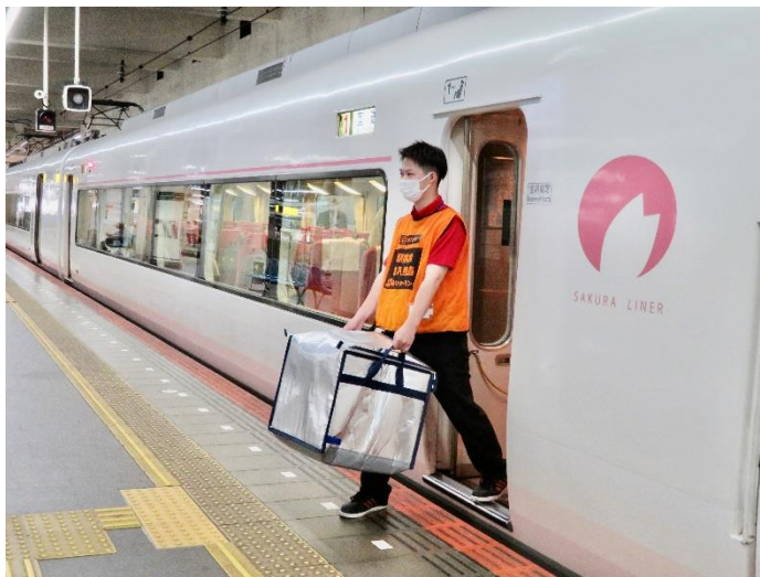
「さくらライナー」からの荷おろしの様子（イメージ）