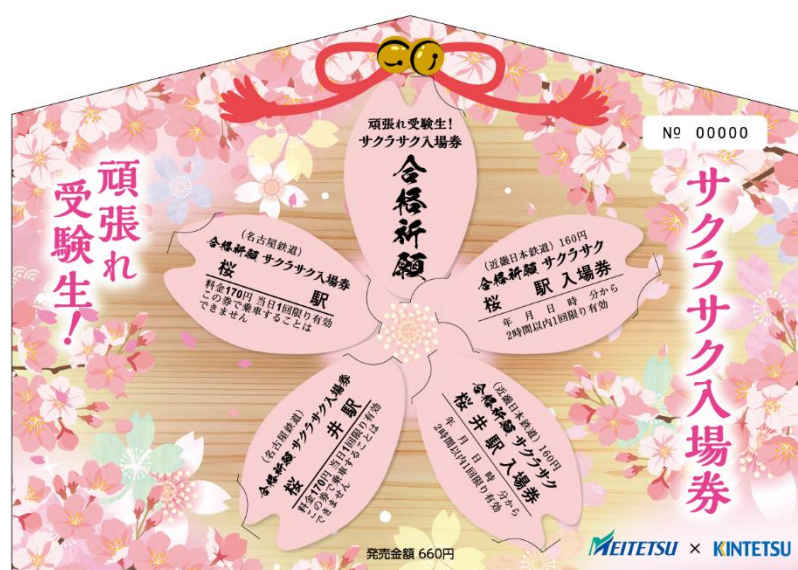
<サクラサク入場券（台紙セットイメージ）>