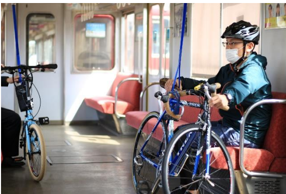
サイクルトレインご利用イメージ