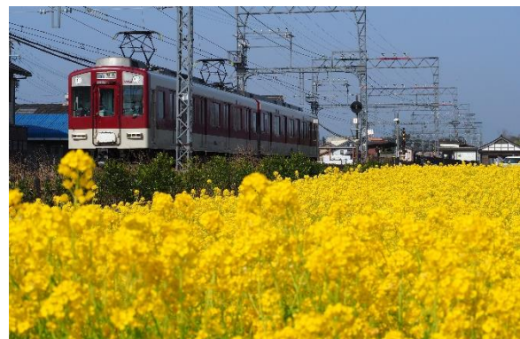
山田線を走行する普通列車