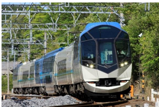
観光特急「しまかぜ」