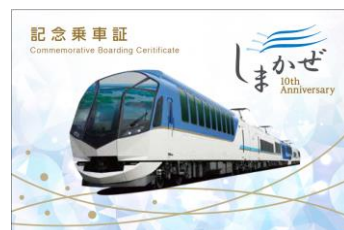
10周年記念乗車証（イメージ）