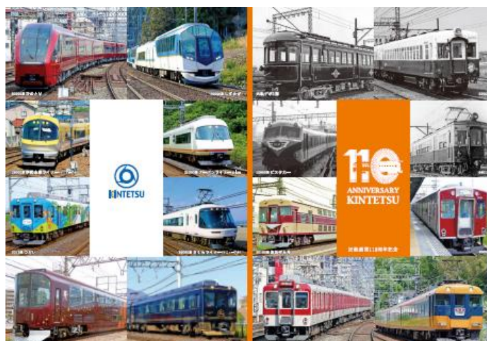
(近鉄創業110周年記念オリジナルノート)