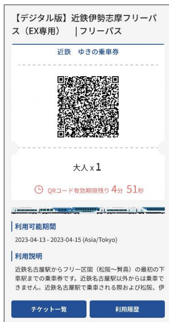
チケット画面（イメージ）