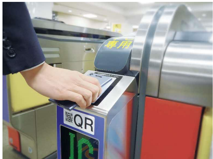
利用イメージ（自動改札機）