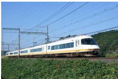
21000系「アーバンライナーPlus」