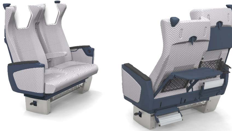
新シート（イメージ）

座面や枕部分の形状、クッションの最適化により快適性を向上させ、ゆったりとおくつろぎいただけるシートとしました。また、コンセント、カップホルダー、物掛フック、かさホルダーを設置して利便性を向上させたほか、肩グリップ上面には座席番号の点字シールを設置し、バリアフリー化も進めています。