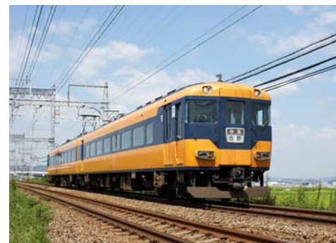
16010系「吉野特急」(狭軌線)