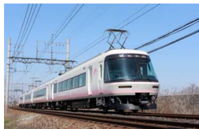
26000系「さくらライナー」