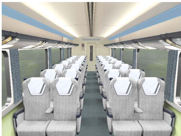
22000系リニューアル車両 インテリアデザイン（イメージ）