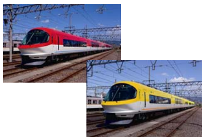
23000系「伊勢志摩ライナー」