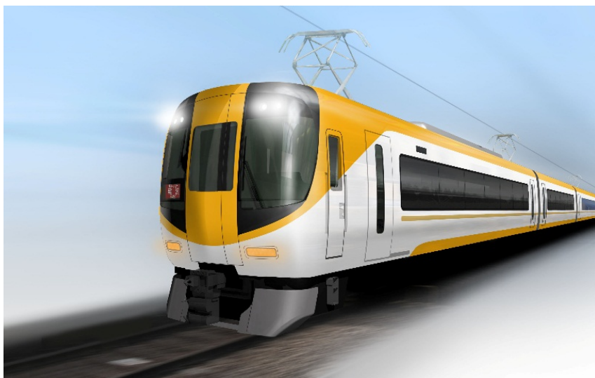
22000系リニューアル車両 新カラーリング（イメージ）

なお、営業運転開始前に「有料試乗会・撮影会」を実施します。詳細は別紙のとおりです。