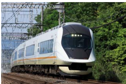
21020系「アーバンライナーNext」