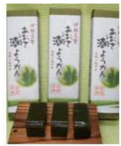
あおさ潮ようかん