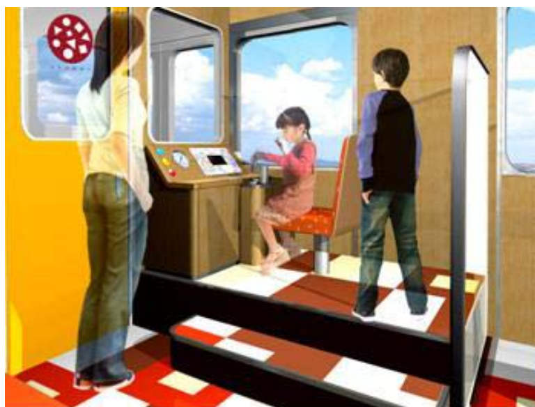
「こども運転台」 イメージパース

運転台を通して前方の景色を見ながら運転操作を楽しみ、運転士気分を味わっていただけます。お子様の運転操作と連動してメーターや表示灯が点灯します。また、子供用の制服を用意しており、記念撮影もしていただけます。