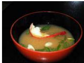
伊勢えび汁 (イメージ)