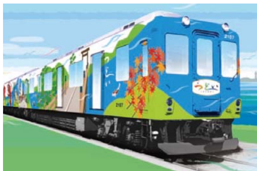
「つどい」外観イメージパース