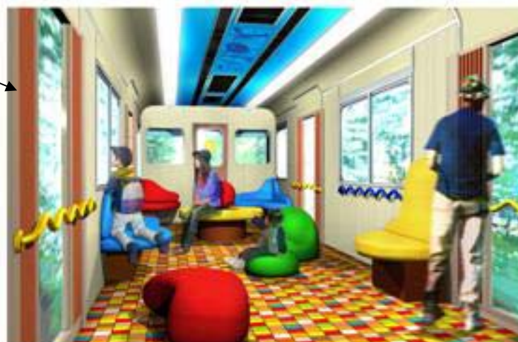
「風のあそびば」 イメージパース