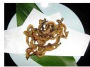
うつぼの唐揚げ (イメージ)