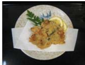
あこや貝貝柱のかき揚げ (イメージ)