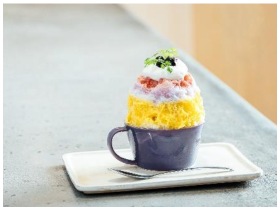
「ほうせき箱」のかき氷（商品例）

「ほうせき箱」Instagram ( https://www.instagram.com/housekibaco/ )