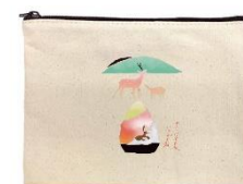
オリジナルキャンバスポーチ (イメージ)