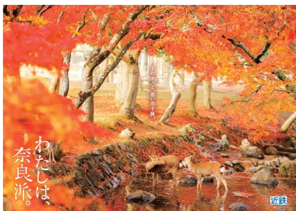
「わたしは、奈良派。」2022秋ポスター

「わたしは、奈良派。」Instagram ( https://www.instagram.com/watashiha_naraha_official/ )