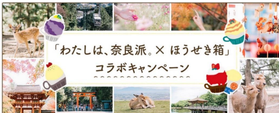
キャンペーン メインビジュアル