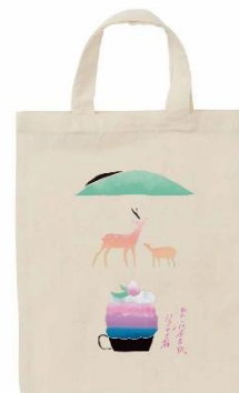
オリジナルA4トートバッグ (イメージ)