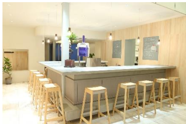
「ほうせき箱」の店舗内観