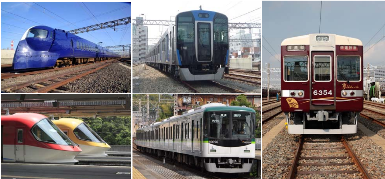
【イメージ図】 上段左：南海 特急ラピート 上段中：阪神 5700系車両 右：阪急 京とれいん 下段左：近鉄 伊勢志摩ライナー 下段中：京阪 10000系車両

ヤマハ株式会社（本社：静岡県浜松市中区、代表取締役社長：中田卓也、以下、ヤマハ）と、阪神電気鉄道株式会社（本社：大阪府大阪市福島区、代表取締役社長：藤原崇起、以下、阪神）、阪急電鉄株式会社（本社：大阪府大阪市北区、代表取締役社長：中川喜博、以下、阪急）、京阪電気鉄道株式会社（本社：大阪府大阪市中央区、代表取締役社長：加藤好文、以下、京阪）、近畿日本鉄道株式会社（本社：大阪府大阪市天王寺区、代表取締役社長：和田林道宜、以下、近鉄）、南海電気鉄道株式会社（本社：大阪府大阪市浪速区、代表取締役社長：遠北光彦、以下、南海）は、駅構内および鉄道車内のアナウンスに、ヤマハが開発した音声アナウンスの内容を多言語の文字情報でスマートフォンに提供できるシステム「おもてなしガイド」を活用する実証実験を「関西5私鉄(阪神・阪急・京阪・近鉄・南海)×ヤマハ Sound UD化プロジェクト」として、2015年11月中旬より当面2016年3月31日(木)までの約5ヶ月間にわたり実施します。期間中は、実証実験で提供するコンテンツの一部を一般の方にもご体感いただける形で、各社の駅や車両にて順次実験を開始する予定です。